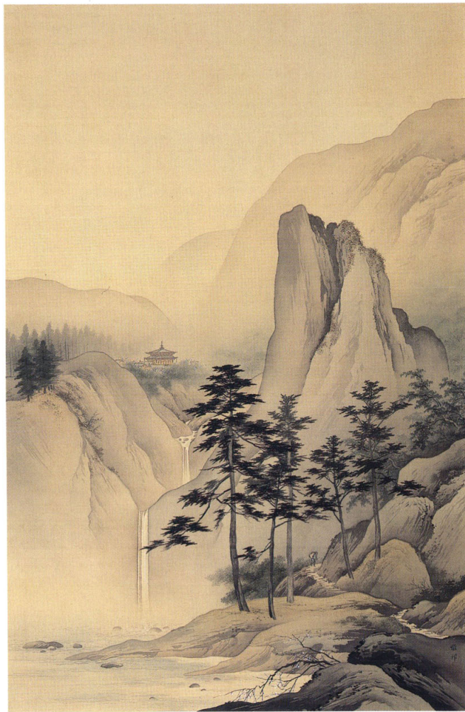
13 橋本雅邦 《春秋山水图》 明治34年(1901)